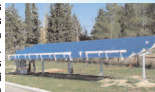
Installation solaire photovoltaïque à concentration

Le système Axiosun est basé sur des concentrateurs à base de miroirs paraboliques linéaires concentrant la lumière 15 fois sur des cellules silicium. Ce type de centrales utilise des systèmes de suivi du soleil 1 axe qui peuvent être orientés est-ouest ou nord-sud.