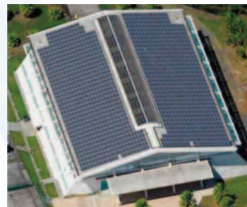
Hopital Saint-François à la Martinique

Les laboratoires stockage de l'électricité et systèmes solaires du CEA à l'INES ont démarré en 2012 le projet ALTAÏS. Ce projet, d'une durée de cinq ans mené en partenariat avec le Syndicat Mixte d'Electricité de la Martinique, vise à maîtriser la variabilité d'une production photovoltaïque au moyen d'un dispositif de stockage ZEBRA (NaNiCl 2 ). Les chercheurs développeront des outils de prévision de la production PV et de la disponibilité énergétique des batteries ZEBRA, puis les intégreront à des dispositifs de gestion dynamique. Un démonstrateur, installé dans un hôpital en Martinique couplera 100kWc de production photovoltaïque à 130kWh de stockage. De quoi tester et valider différentes stratégies en connexion au réseau d'électricité et aussi à des fins d'autoconsommation.