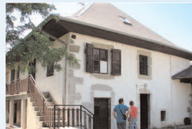
Une des deux premières maisons rénovées et en cours d'évaluation

Mis en œuvre par INES Education et soutenu par le conseil régional Rhône-Alpes, le Conseil général de la Savoie et l'ADEME, le projet de suivi énergétique de maisons basse consommation en Rhône-Alpes enregistre les performances réelles de 12 maisons, usage par usage. Ces maisons sont choisies parmi les 2 appels à projet « 100 maisons basse consommation » et « 100 rénovations basse consommation » lancés par la Région Rhône-Alpes.